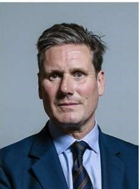
Prime Minister (miniszterelnök)